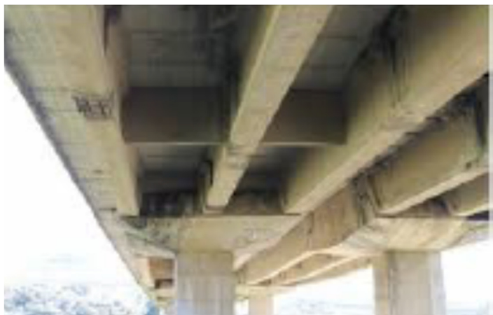
Figura A.1 – Impalcato tipico di Ponte a travata in c.a.p. con sezione aperta e travi parallele

Con riferimento al caso di Figura A.1 , che rappresenta l'impalcato di un tipico ponte a sezione aperta con travi parallele, l'esempio di identificazione riportato nel seguito a titolo meramente indicativo, e comunque non esaustivo, è inteso a meglio illustrare la sequenza di scomposizione in sottoelementi e lo schema per la loro identificazione ( Figura A.2 ). I sottoelementi devono essere accompagnati da opportune misure (m o m 2 ), utili per la valutazione dell'estensione del degrado e dei costi di ripristino.